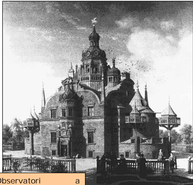
Observatori a Uraniborg, on va fer gran part de les

En mesurar la latitud del seu observatori a Uraniborg va notar una diferència sistemàtica entre dos mètodes diferents: l'altura de l'estrella polar i l'altura màxima del Sol en els solsticis. La diferència era de 4' per la latitud. Tycho va interpretar correctament el fenomen com degut a la refracció atmosfèrica que fa que l'altura aparent d'un astre sigui major que l'altura real sobre l'horitzó. Tot i els seus errors (per exemple el fet de suposar que la refracció és nul·la per a altures majors de 45°) va ser el primer cop en abordar aquest problema en astronomia.