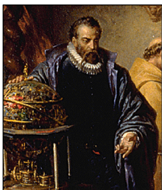
Quadre de Tycho Brahe

Va néixer el 14 de desembre del 1546, a la ciutat danesa de Skane (en l'actualitat pertany a Suïssa). Per conveni del seu pare, va ser criat per el seu oncle, Jorhen Brahe, tots pertanyents a l'alta noblesa danesa. Als tretze anys va ingressar a la Universitat de Copenhagen on va estudiar Dret i Filosofia, i posteriorment s'orienta a les Matemàtiques i l'Astronomia. Però als disset anys, va observar una conjunció 1 entre Júpiter i Saturn, on va trobar errors de posició a les taules. Per aquest motiu es va plantejar realitzar mesures més precises.